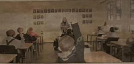
GODT FORBEREDT: De eldste elevene, 12 i tallet, fra 5. til 7. trinn i klasserom i 2. etasje på Bergsbakken skule. Det så virkelig ut som fullverdig klasserom da elevene satte seg ned ved sine pulter for lære.