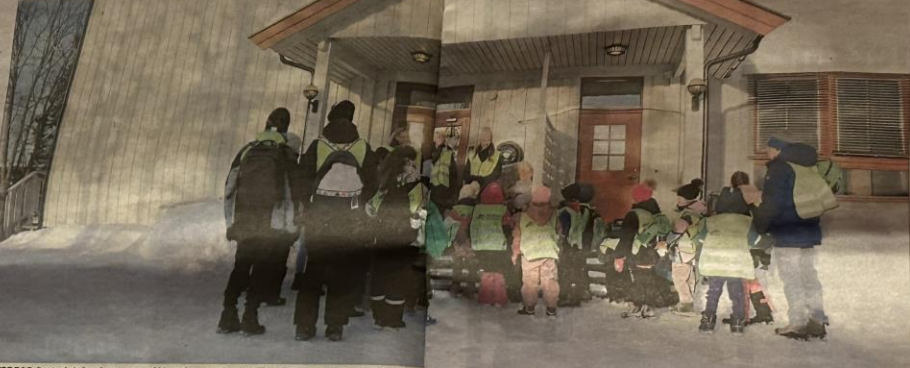
EN STOR DAG: Første skoledag gjennom man aldri, og elevene var omtrent like spente som lærerne som tok imot dem i gruppa på Bergsbakken skule. De ukrainske barna var 25 i tallet. I tillegg kommer elevene på ungdomstrinnet, som hadde sin første skoledag tirsdag.