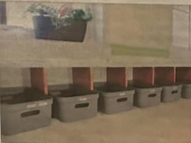
HVER SIN KURV: Elevene hadde fått hver sin plass og er personlige eiendeler før skolestarten på Bergsbakken skule.