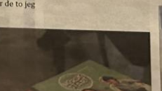
KOM I GANG: Elevene på 1. til 4. trinn fikk hver sin lærebok i norsk.