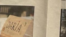
NAVHESKILT: Hver enkelt elev hadde fått navneskilt på pulvertin, så det var lett å se hvor de skulle sitte.